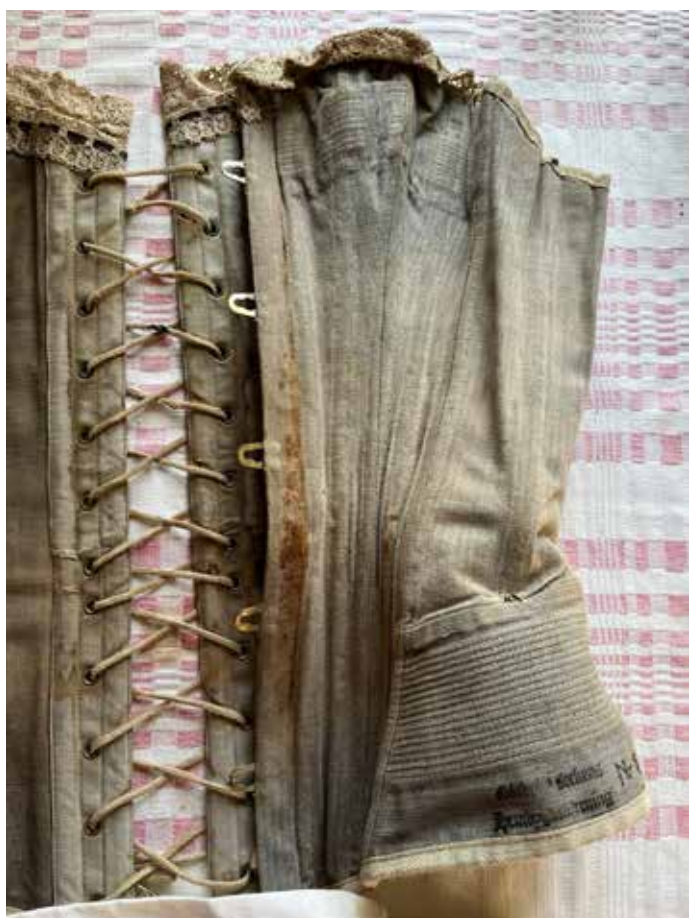
Korsett från en av byrålådorna.

Sen vandrade vi in i kammaren. På bordet hade vi dukat upp underkläder från byrålådorna, mamelucker, skjortbröst och lösmanschetter och både särk och korsett tillsammans med en liten barnhatta med spetsar. På sängen låg tomma, randade bolster-var och en fäll med en rosenängsväv. I ena hörnet hade vi hängt upp det yngsta plagget vi plockat fram, en handsydd klänning från första hälften av 1900-talet.