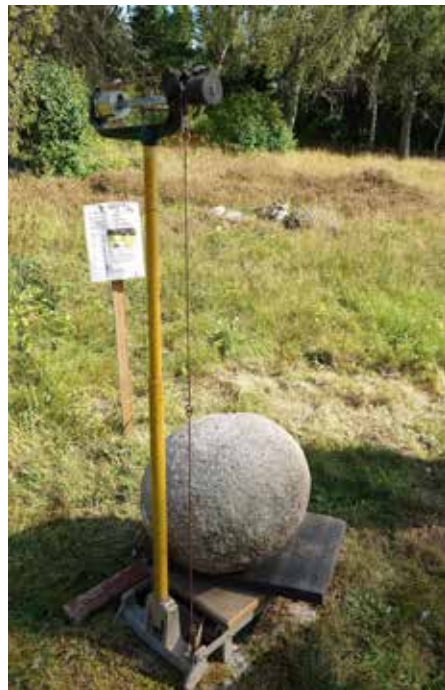
Invägning av drängastenen inför Hoppetdagen, det blev 124,5 kg.