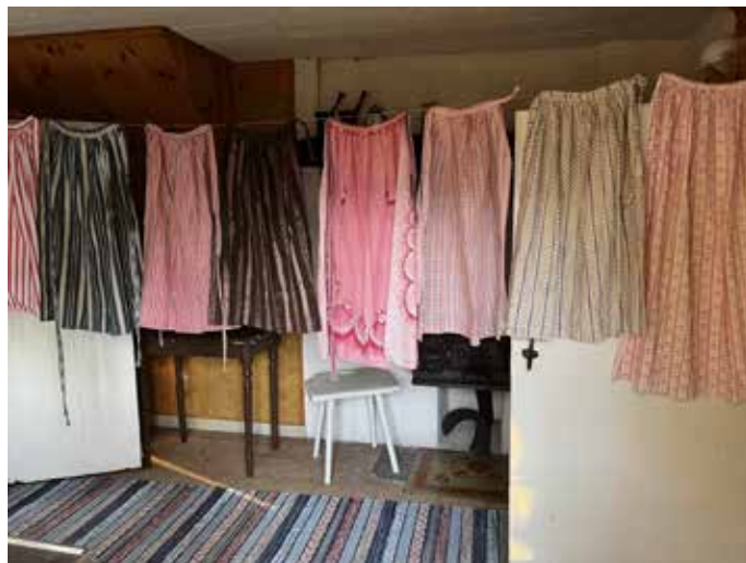
Förkläden från 1800-1900-talen i Hoppets kök.

Från kammaren tog vi besökarna till köket där vi hängt upp en rad med förkläden. De var placerade som en tidslinje från 1900-talet till 1800-tal och besökarna fick fundera på om de tryckta förklädena var äldre eller yngre än de tvärrandiga och handvävda. Många gissade att de tryckta kattunerna var de äldsta och det var ju helt rätt.