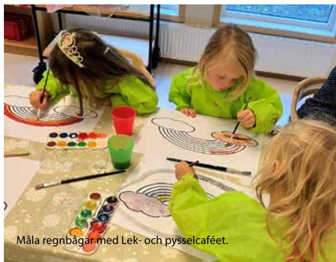
Måla regnbågar med Lek- och pysselcaféet.