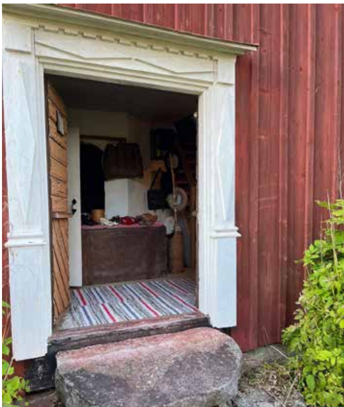
Välkommen till hembygdsgården i Gårdsby!