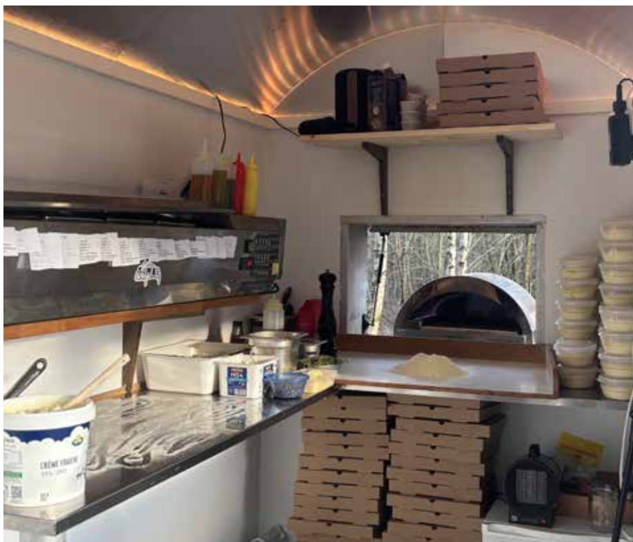
Pizzavagnen är färdigpreppad för utbak, gräddning och servering.