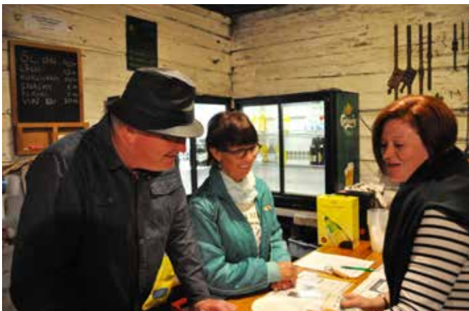
En av många kunder.