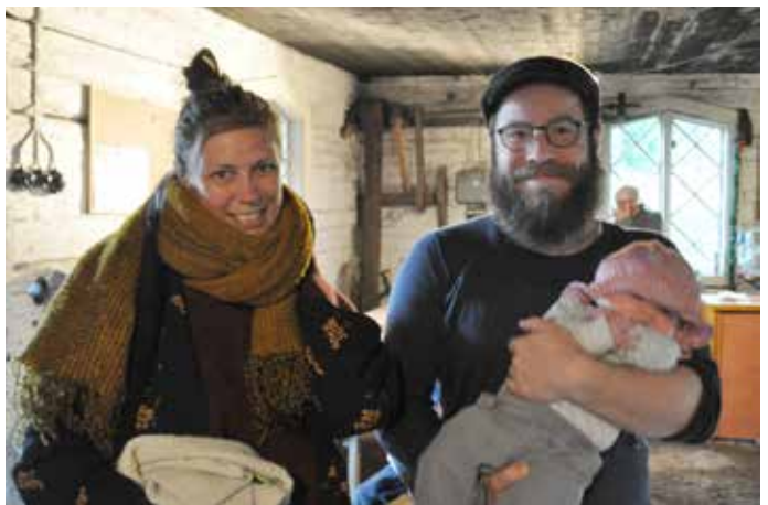
Det ska börjas i tid.