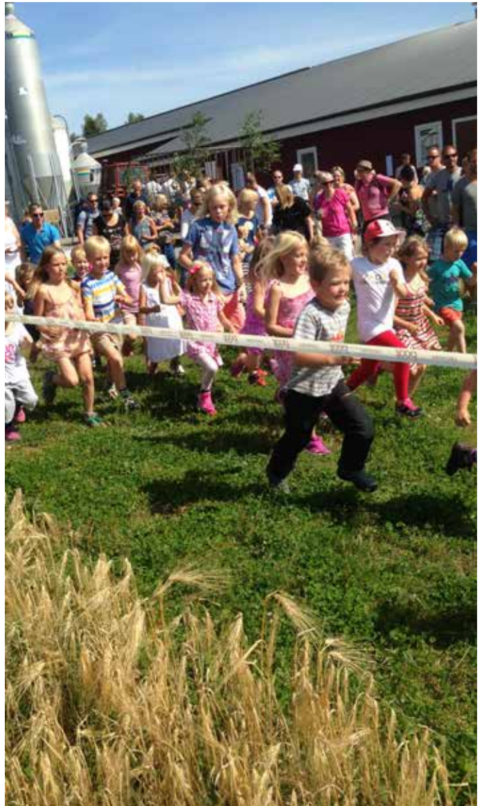
Likå hönsloppet är en återkommande aktivitet.