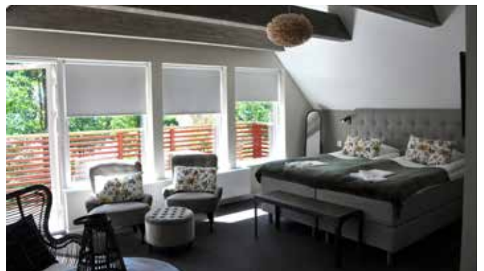
Här ser vi bröllopssviten.