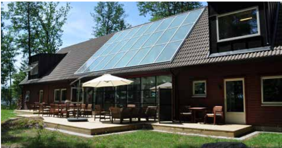
Nya hotellets terasser.