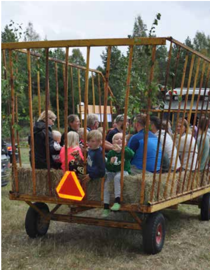
Åka traktor med lövad skrinna var populärt förra året.