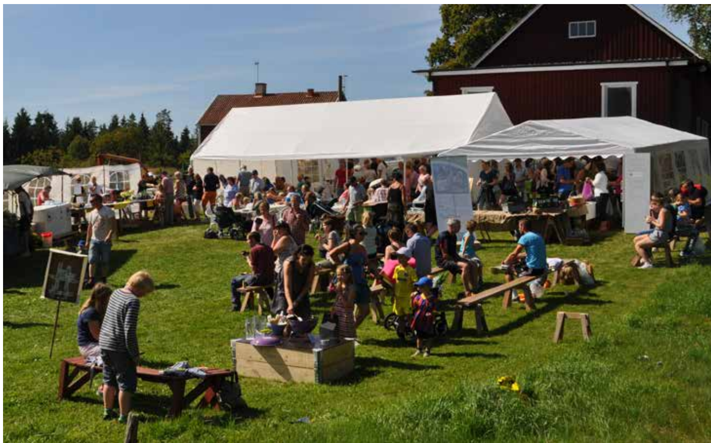
Från matmarknaden 2017.