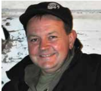
Nu mår jag gott.