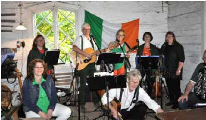
Medryckande musik av Hugo vänner.