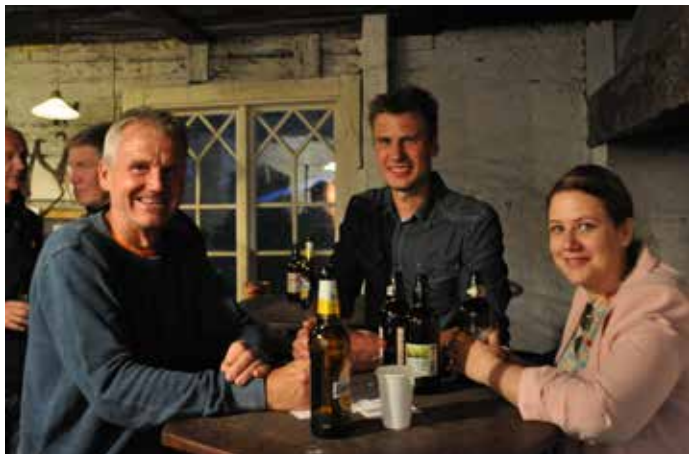
En öl är aldrig fel.