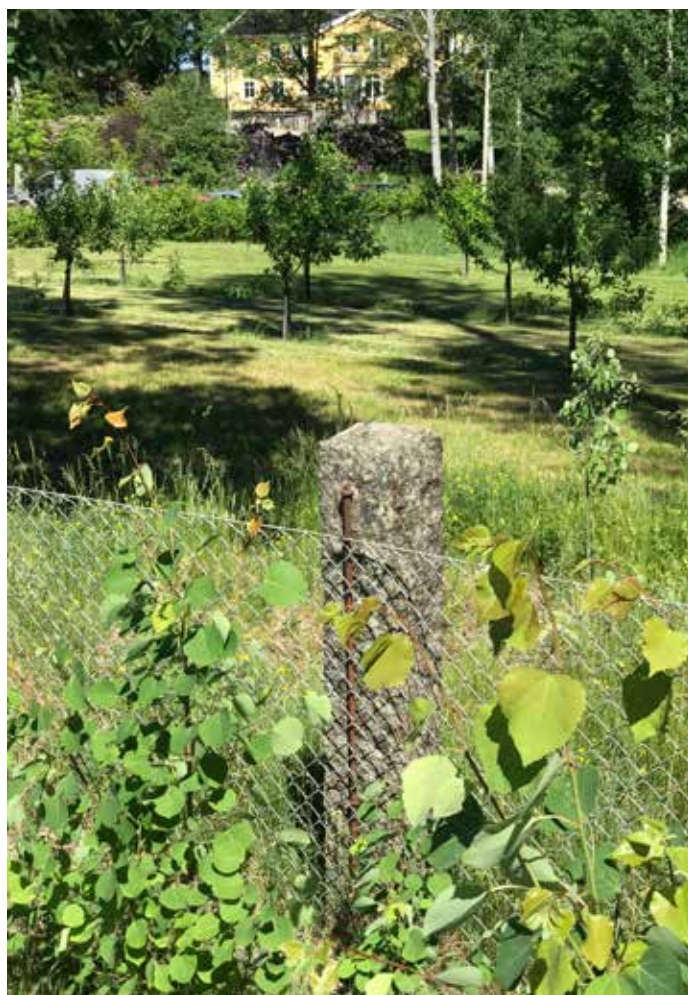
En av Villa Viks 240 stenstolpar.

Senare tillkom mer bearbetade stenstolpar längs infarten till Villa Vik samt piren nere vid stranden. Dessa gjorde Mulle-Pelle, vilken även hade gjort stenarbetet till Teleborgs slott.