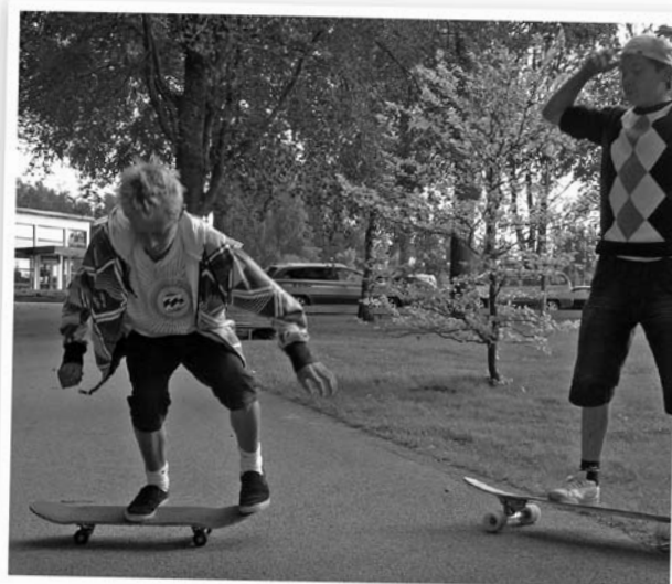
Ett trick ska visas... Men oj, fixar du det?