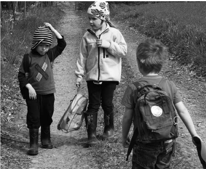
Utdag i Gasslanda med Trollbacken.