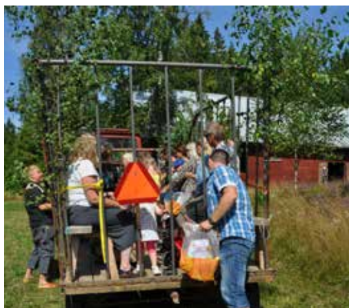
Åka traktor med vagn är kul.