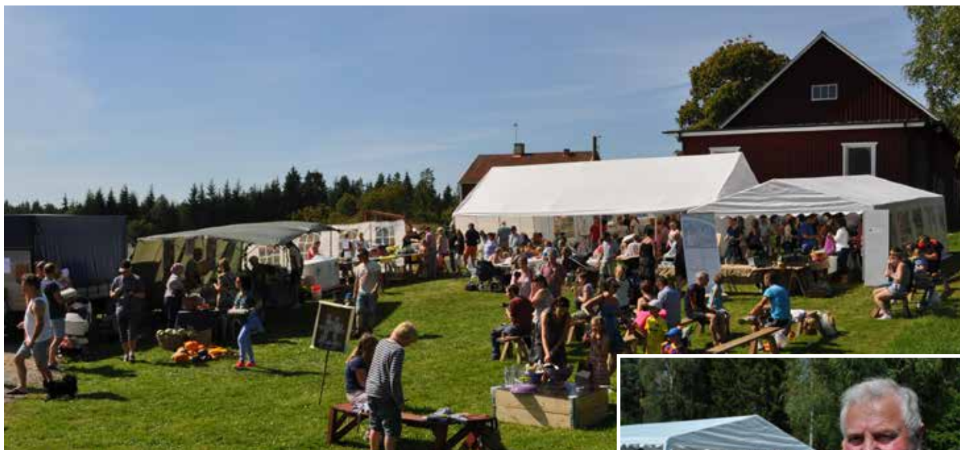
Mycket folk samlades på matmarknaden i Tångshult.