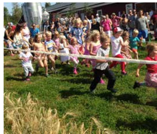
Det populära hönsloppet.