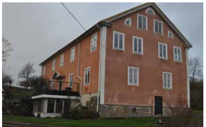
Här ser vi Masizas bostad.

Masiza är och förblir en sjutusan till KONSTHANTVERKÄRE !