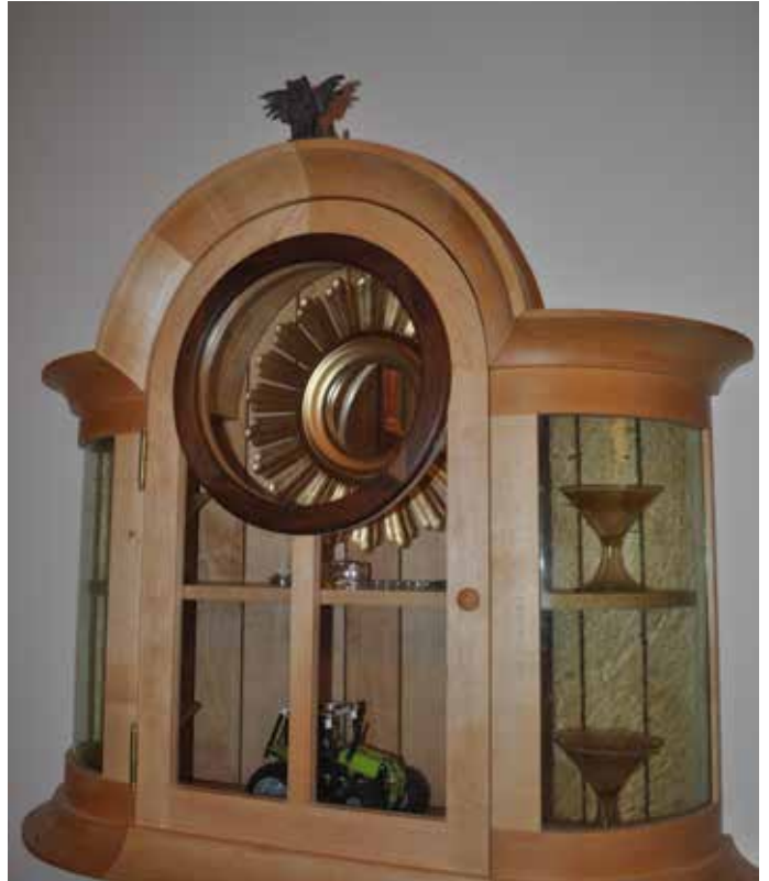
Här ser vi ett av Masizas konstverk.