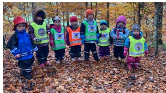
Bild 2: På höstlovet var vi i bokskogen bakom Trollbacken och sprang bamseloppet. Här är det ingen som kommer först eller sist i mål utan alla tar sig fram efter sin förmåga över stock och sten. Här erbjuds rörelsegädje på hög nivå!!

På eftermiddagarna på fritids erbjuds olika aktiviteter, här valde några barn att bygga och samarbeta kring en jätterobot (översta bilden) och andra hjälpte varandra med att vika pappersdjur.