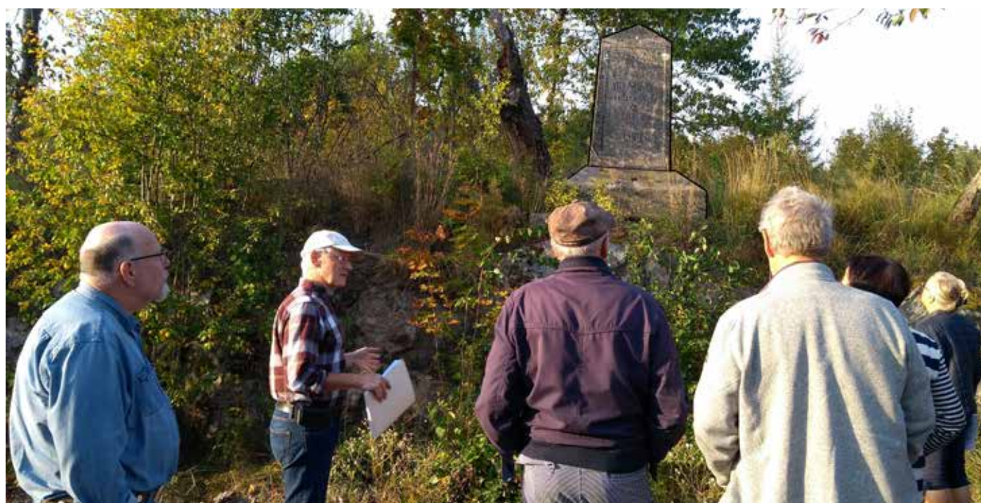
Monumentet från 1849 där man "firar" att stora vägen ut från Växjö mot Kalmar fått en bättre sträckning.