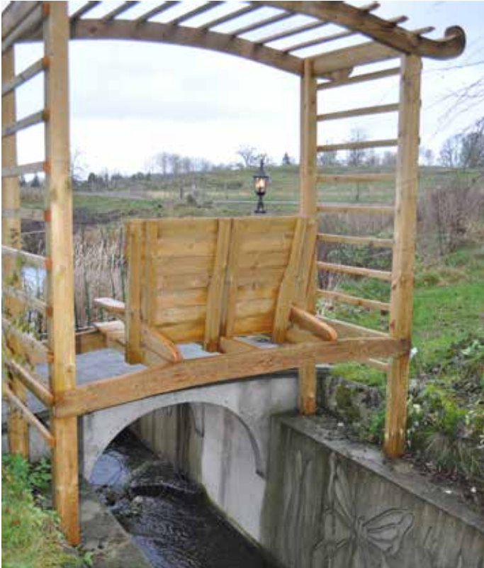
Här har Masiza byggt en avstressningsplats.