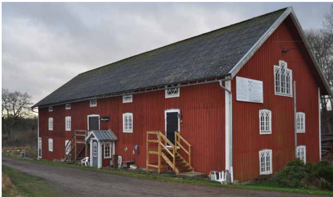
Hantverkshuset i Gårdsby.