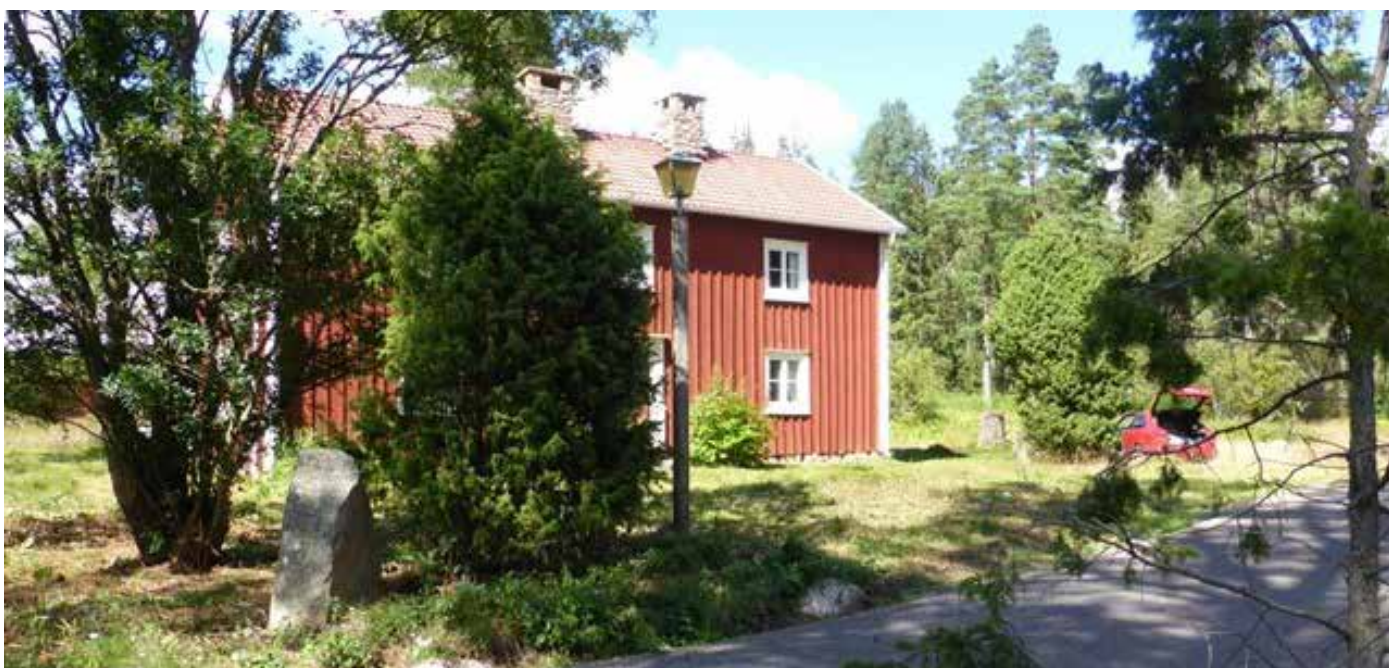
Så här ser det ut augusti 2020, och marken runt huset kan kanske bli vacker gräsmatta igen. Ett par glada gubbar jobbade två halvdagar med att börja återställa lite av det forna.