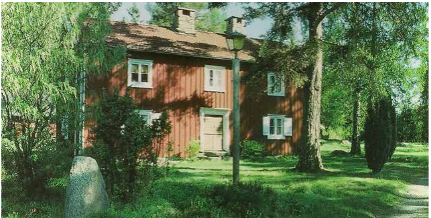
Här är en bild från ett av våra vykort, troligen från 1980-talet