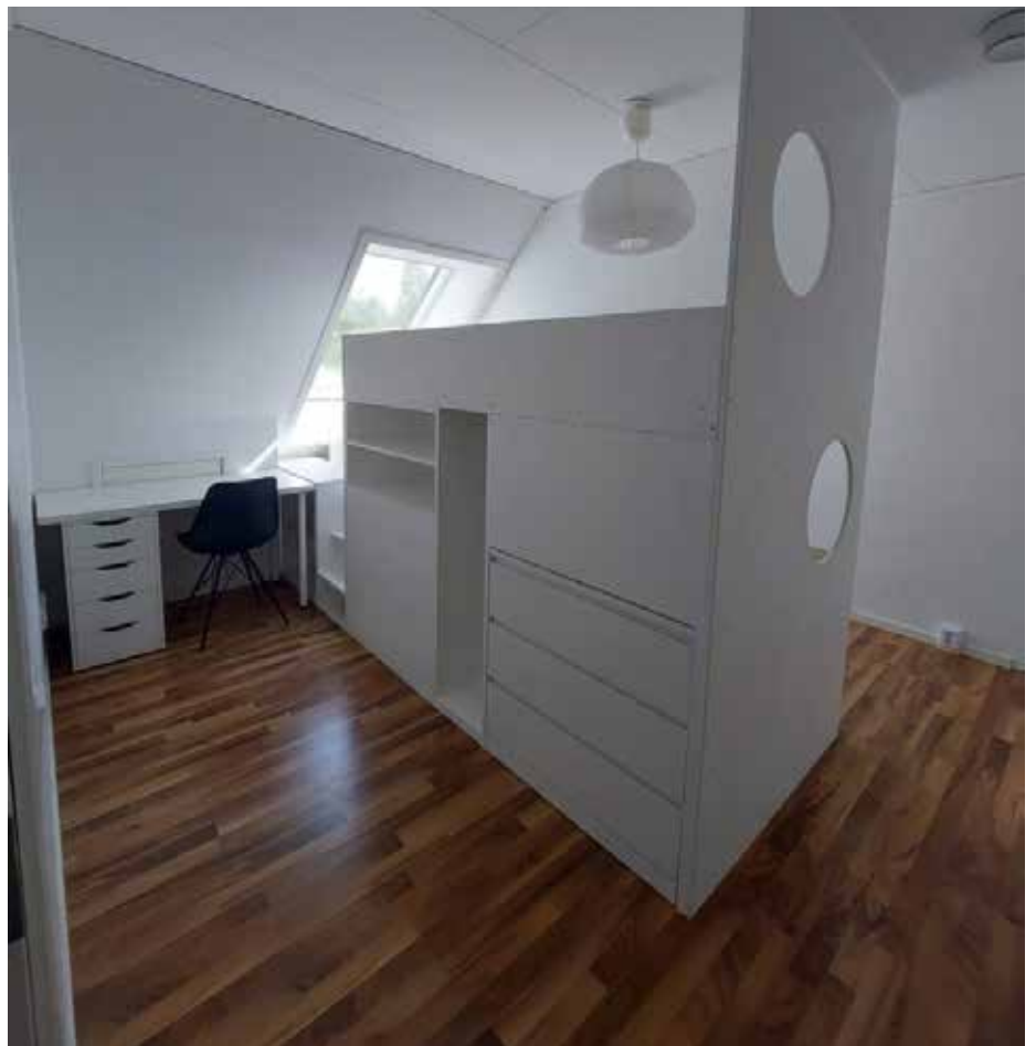
Rumsavskiljare för två barnrum med massor av smart förvaring.

Mer information kommer på Instagram: @masizagowenius