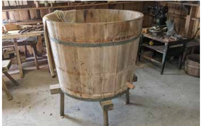
Den stora tunnan för tvätt och pluggen för hålet nertill när vattnet skulle bytas.

När tvätten var torr var det dags för mangling och strykning. En byketvätt kunde ta flera dagar.