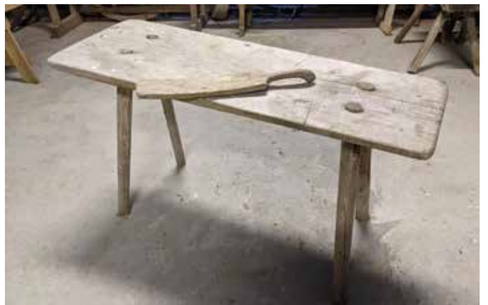
Ett klappeträ och en klapptavla på hembygdsgården.

Björkaska kallas också pottaska och är en alkalisk lösning som löser smuts och fett. Pottaska användes bl.a. vid tvättillverkning.