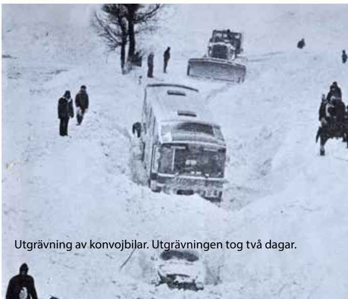
Utgrävning av konvojnbilar. Utgrävningen tog två dagar.