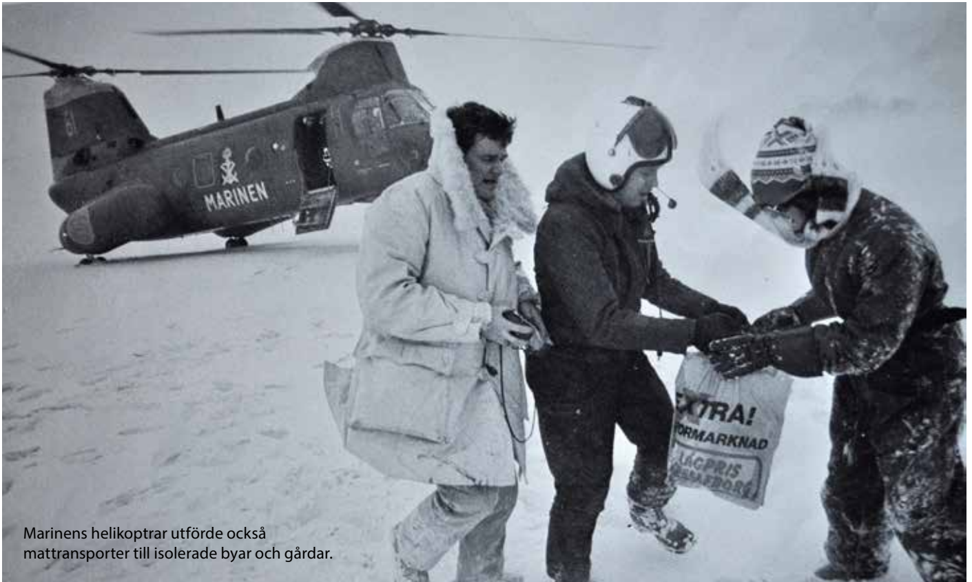
Marinens helikoptrar utförde också matttransporter till isolerade byar och gårdar.